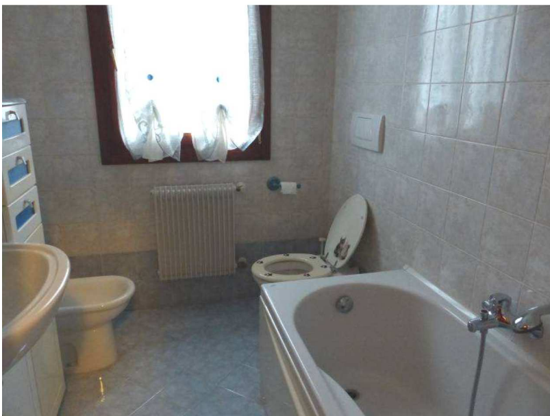
FOTO 05 BAGNO