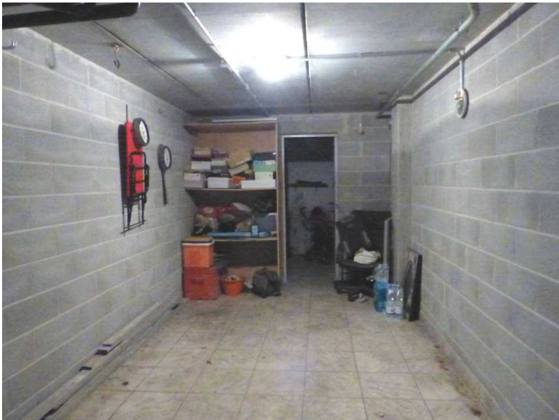
FOTO 08 GARAGE