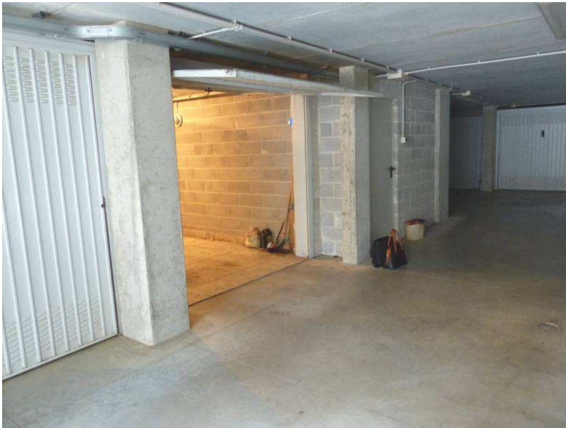
FOTO 07 INTERRATO AREA DI MANOVRA