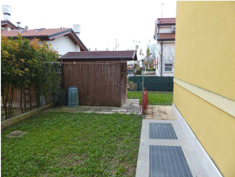
FOTO 02 GIARDINO PRIVATO