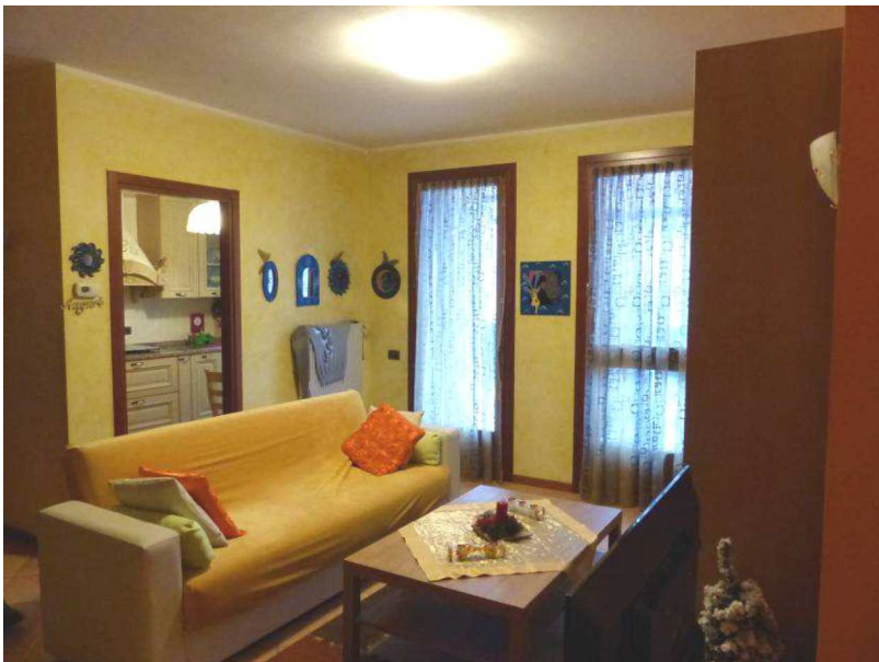
FOTO 04 SOGGIORNO