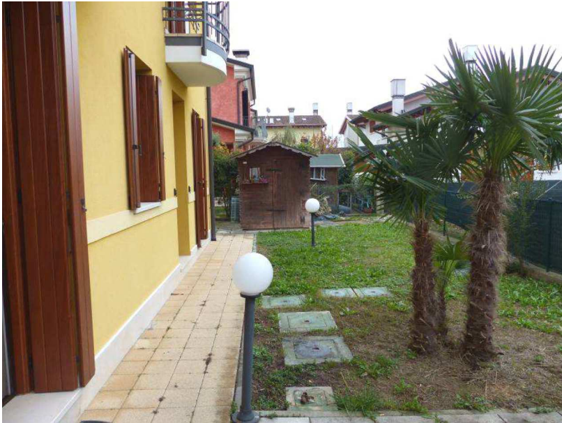
FOTO 01 GIARDINO PRIVATO