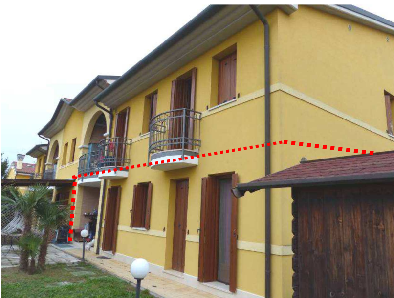
FOTO 03 GIARDINO PRIVATO