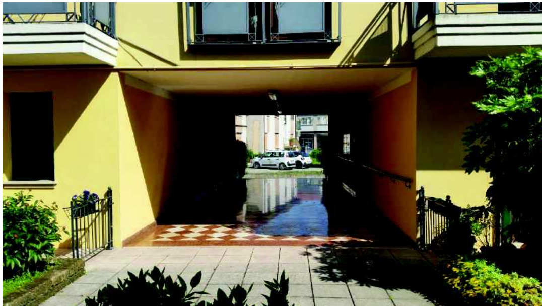
Vista dell'ingresso da Via San Francesco civ. 90, dalla corte interna