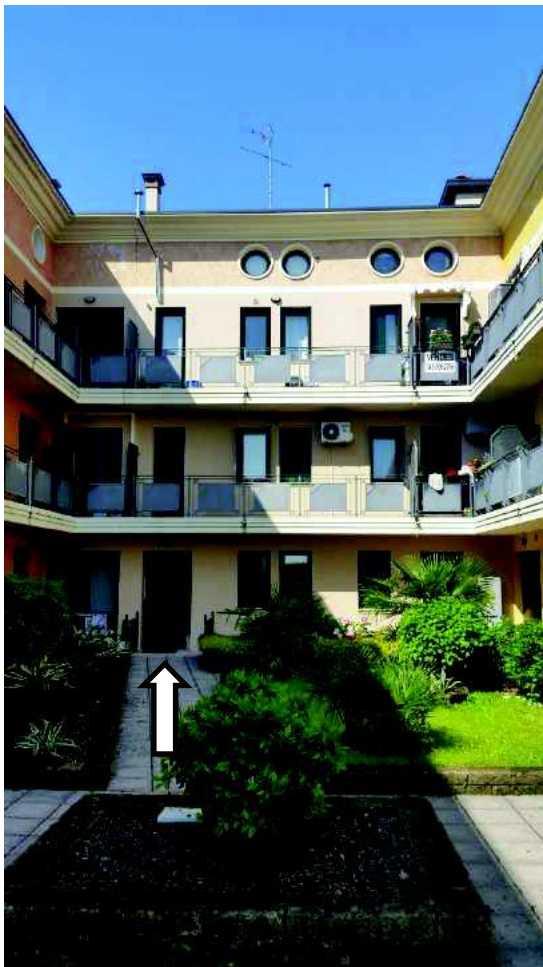
Corte interna con indicato l'ingresso alla scala D