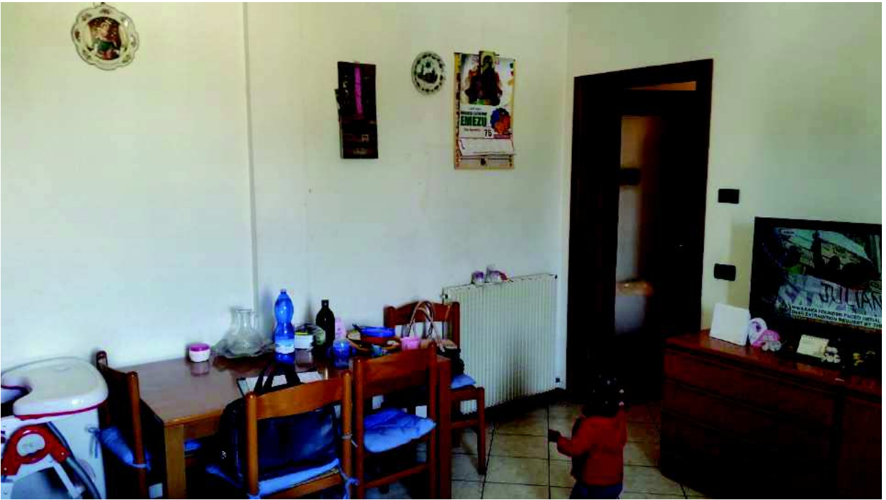
Soggiorno – pranzo