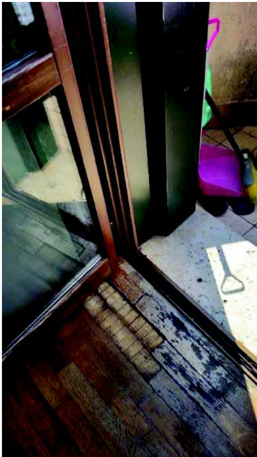
Particolare serramenti / pavimento in legno