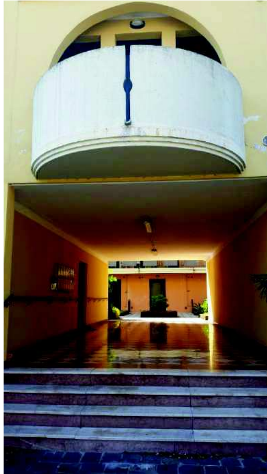
Ingresso alla corte interna da Via San Francesco civ. 90