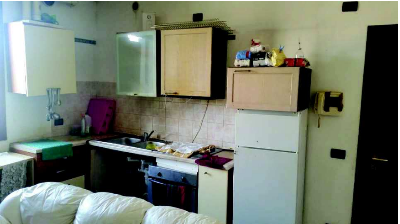
Angolo cottura con visibile la caldaia murale sulla sinistra