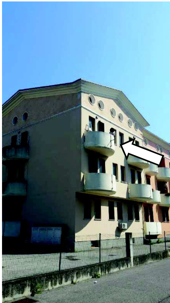
Prospetti Nord-Ovest con indicato l'appartamento al Secondo Piano