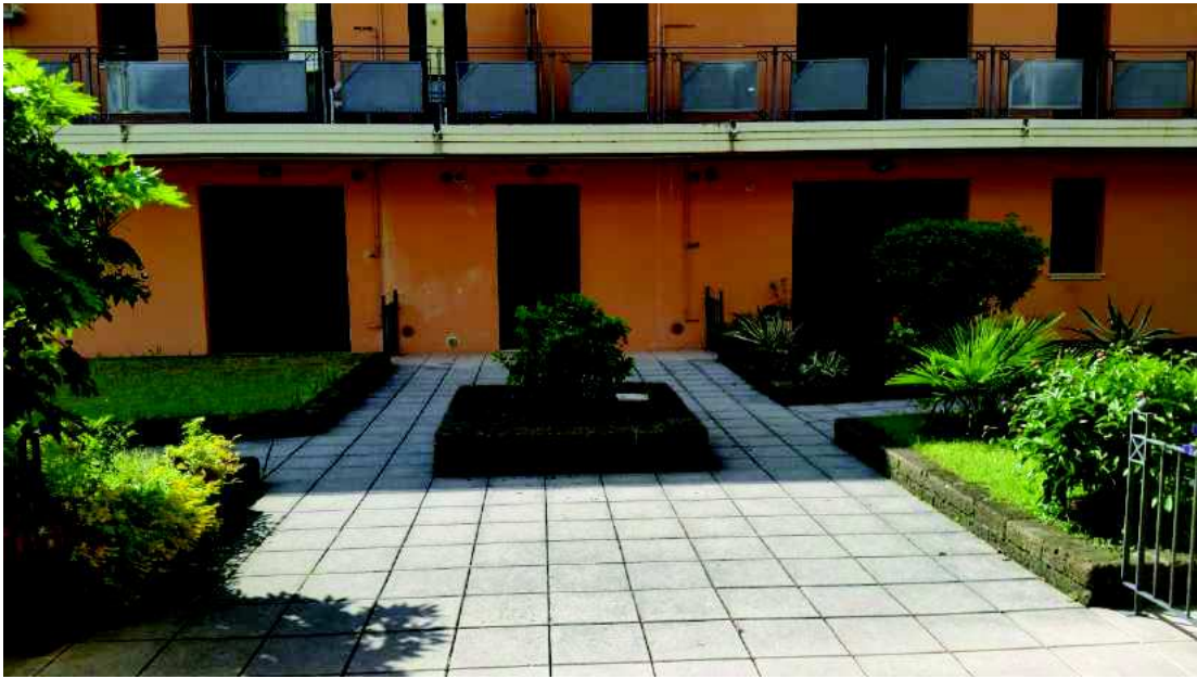
Corte interna del condominio