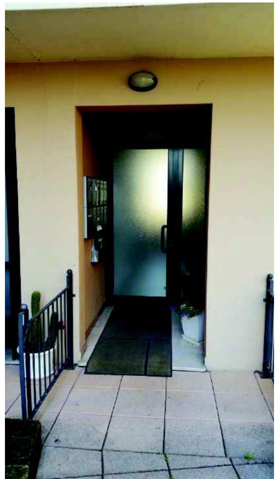
Ingresso al piano terra della scala D